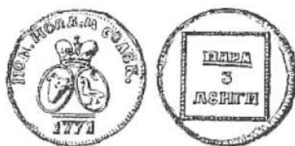
Пара 1771 г.