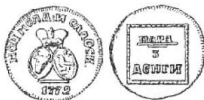
Пара 1772 г.